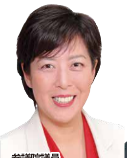
参議院議員 田名部 匡代