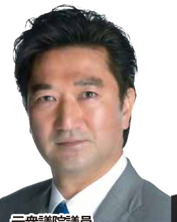
元衆議院議員 升田 世喜男